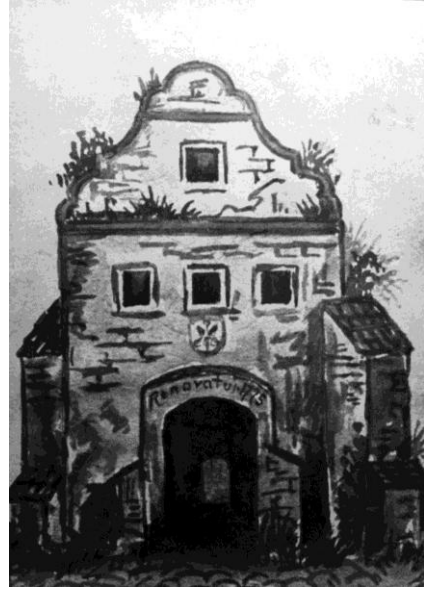
Ryc. 5. Głogówek, Brama Wodna (Prudnicka), widok od wschodu sprzed rozbiórki 20 .