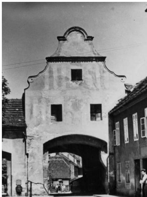
Ryc. 9. Głogówek, Brama Zamkowa, widok od południa z lat 60-tych XX wieku.