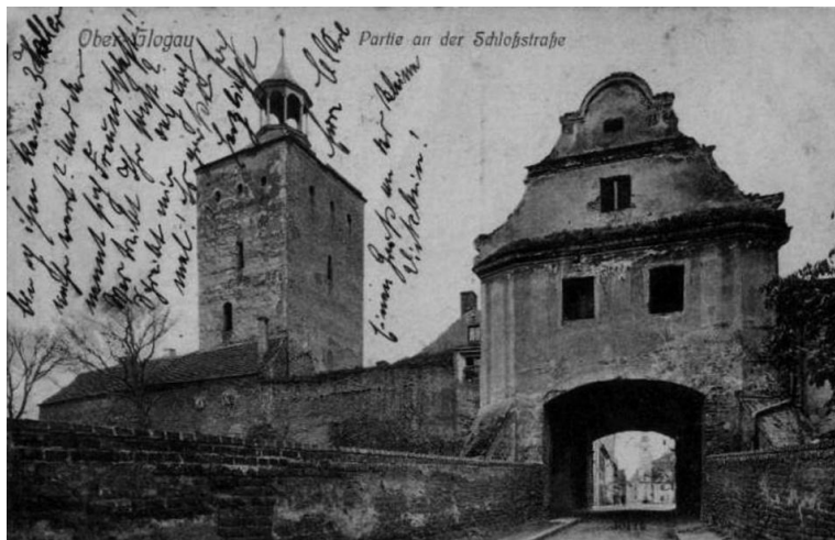
Ryc. 7. Głogówek, Brama Zamkowa, widok od północy z początku XX wieku.

Górna kondygnacja pełniła prawdopodobnie funkcję obronną. Mury obwodowe zwieńczono otworami szczelinowymi, z których trzy rozmieszczono w ścianie zachodniej. Ganek wewnętrzny oparto na murach ceglanych w dolnej partii wywnętkowanych (trzech od wschodu i czterech od zachodu), umieszczonych w poziomie przejazdu. W przyziemiu, w obu ścianach bocznych w parze pierwszych od południa wnek, założono otwory nakryte łukiem półkolistym, umożliwiające obserwację przestrzeni pod kurtyną.