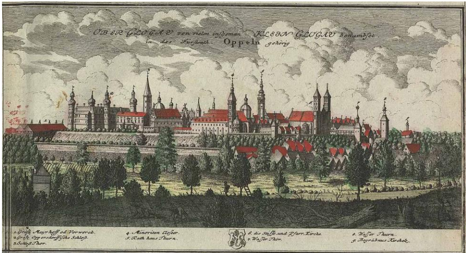
Ryc. 3. Głogówek, panorama miasta od zachodu w połowie XVIII wieku, według F.B. Wernera (Biblioteka Uniwersytetu Wrocławskiego, Oddział Zbiorów Graficznych, sygn. S-69).