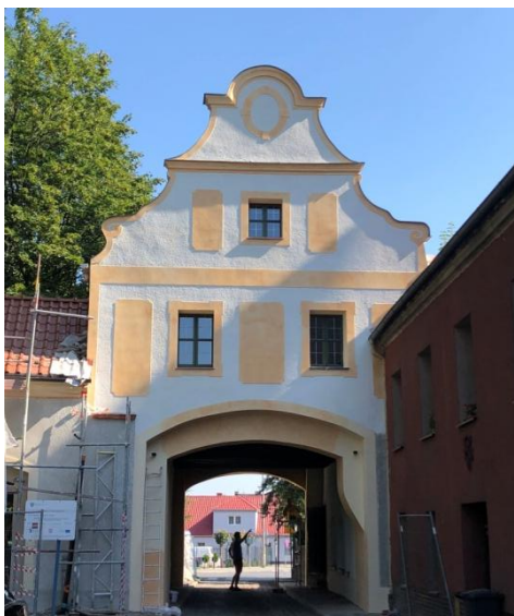
Ryc. 10 Głogówek, Brama Zamkowa, widok od południa, stan z sierpnia 2018 - po zakończeniu prac.