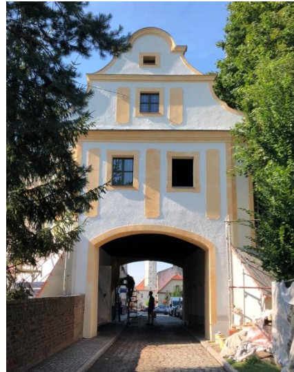
Ryc. 2. Głogówek, Brama Zamkowa, widok od północy, stan z sierpnia 2018- po zakończeniu prac.