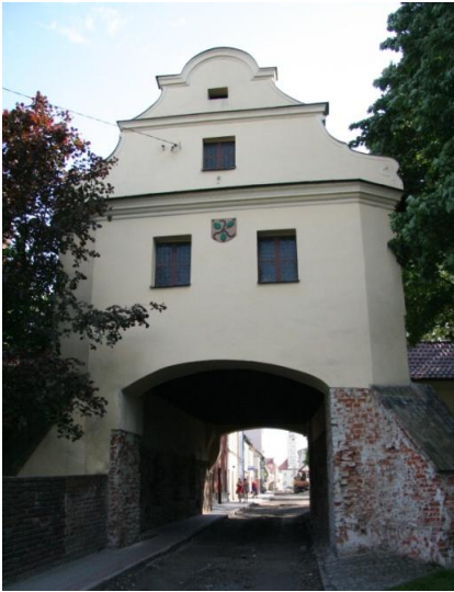
Ryc. 1. Głogówek, Brama Zamkowa, widok od północy, stan z 2013 roku.