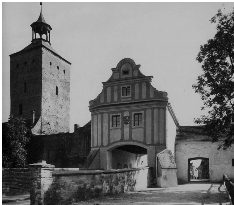
Ryc. 8. Głogówek, Brama Zamkowa, widok od północy z około 1937 roku

We wnętrzu bramy założono stropy wydzielając na piętrze dużą salę. Doświetlono ją parami okien od południa i północy, oraz dwoma od wschodu. Otwory zabezpieczono od wnętrza drewnianymi okiennicami. Wejście na piętro z poziomu przejazdu zlokalizowano w narożu północno-wschodnim. Na schody, umieszczone w grubości ściany, prowadził prostokątny otwór drzwiowy zamknięty metalowym skrzydłem ozdobionym kratownicą rombowa.