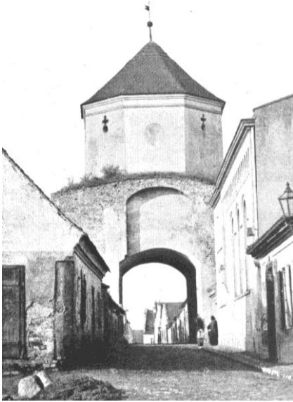
Ryc. 4. Głogówek, Brama Kozielska, widok od wschodu sprzed rozbiórki 19 .