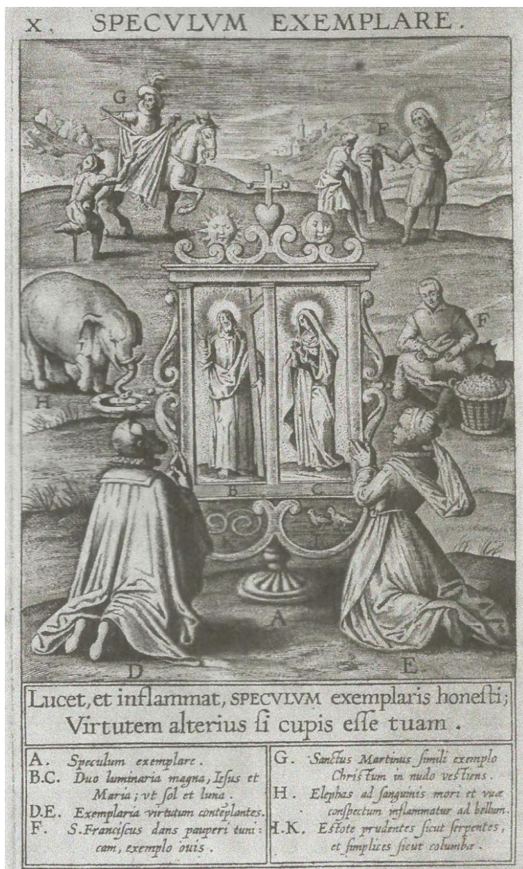
Ryc. 2. Speculum exemplare , [w:] J. David, Duodecim specula Deum aliquando videre desideranti concinnata , Antwerpia 1610, s. 126